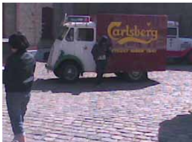
En gammel ølvogn og yderligere en turist.

På en meget varm dag virker pengespørgsmål altid lidt trivielle, så vi betalte og fik også ren information om hvor turen rundt på Carlsberg skulle begyn-