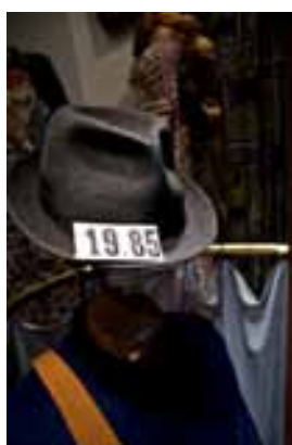
Produkter og prisen på en hat fra: A. C. Hansen Trikotage 1950'erne

Et andet faktum er, at alle udstillingsobjekterne er forsynede med lange indgå-