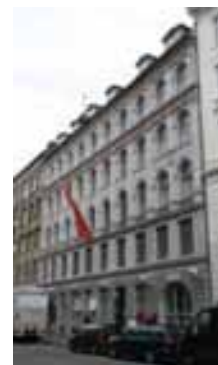
Arbejder museet, Rømersgade 22 1362 Kbh. K. Tlf.: +45-33 93 25 75

Her i HovedHuset, har vi altid åbent så der altid er adgang for os, når vi trænger til lidt mere indhold i hverdagen. Men oven i det, er der over sommeren sørme også udflugter til forskellige steder her i København. 29. juli var vi eksempelvis på Arbejdermuseet. Læs mere om det på side 2.