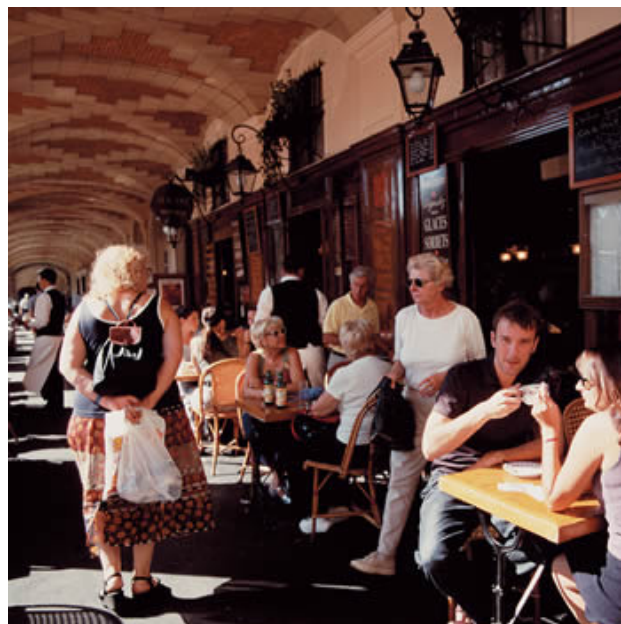
Café i Paris.