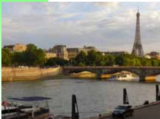
Et billede af Paris, som de nu forefindes på nettet (www).