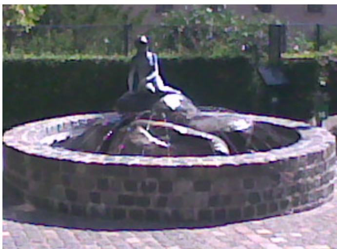
Den Lille Havfrue hos Carlsberg.