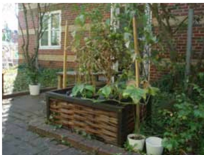
HovedHusets terrasse og de spæde gevækster i vores 'nye' have. Der er dog flere planter - blot ikke på dette billede som viser tomat- og agurkeplanter (i selv-vander-kassen). PÅ næste side er der yderligere eksempler på vores haves indhold af liv!

selv-vandings-kasser med tomat- og agurke-planter ☺ I haven har vi også diverse blomster som margeritter, chokolade-blomst, pelargonier og mange andre. Der er også et par krydderurter som oregano og timian. Det er skønt at have en have, men den skal jo også passes og plejes, så en gang imellem er holdet i aktion og vander og nipper i stor stil. Vi har både høstet agurk og tomat fra planterne.