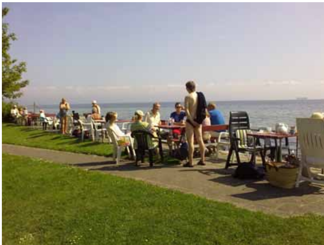
'Hele Sjakket samlet ved "Stranden".'

Torsdag 06-08-09 holdt vi vores ugentlige "ud-af-huset-dag". I uge 33 gik turen til "Stranden."