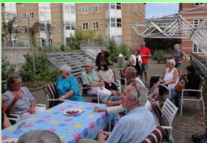
Hyggelig samvær på terrassen.

Som en dejlig optakt til arrangementet blev der serveret jordbær og hyldeblomstsaft med dansk vand ude på terrassen.