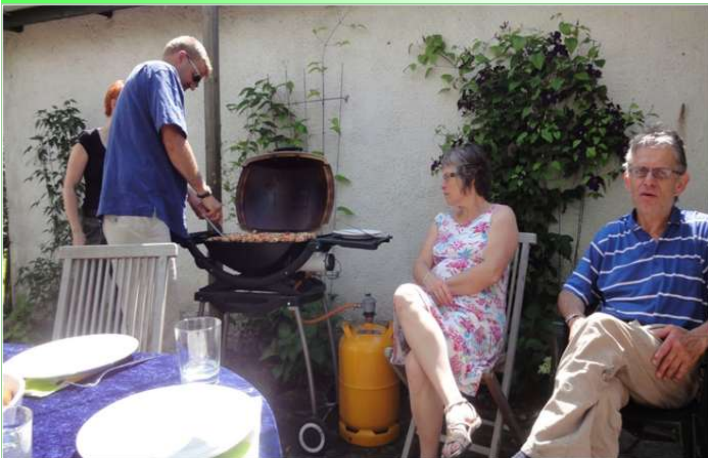
Robin var grillmester.