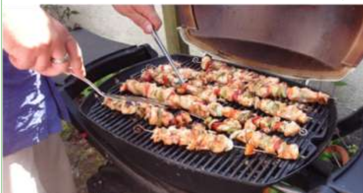
Så er kyllingespyddene vist ved at være klar!