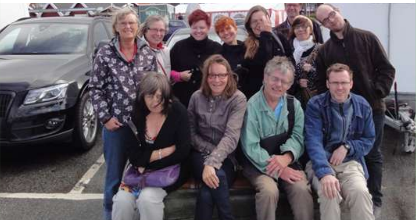
Gruppebillede nede ved Hornbæk havn. Regnen var stoppet for et øjeblik og solen var fremme.