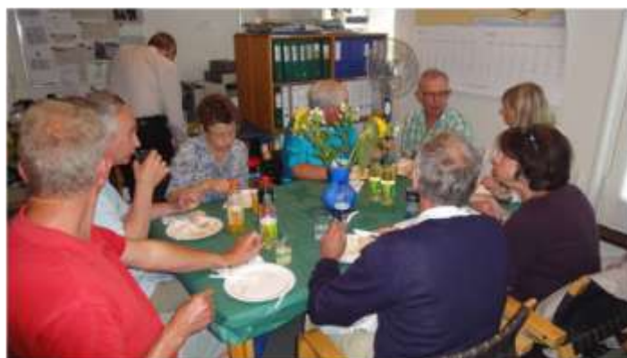
Hyggeligt samvær rundt om bordet.