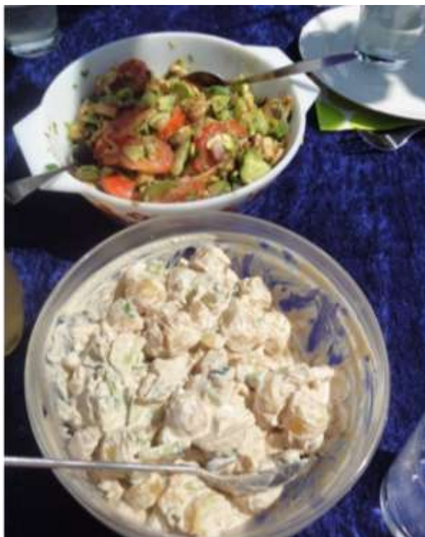
Avocado- og kartoffelsalat –meget velsmagende!