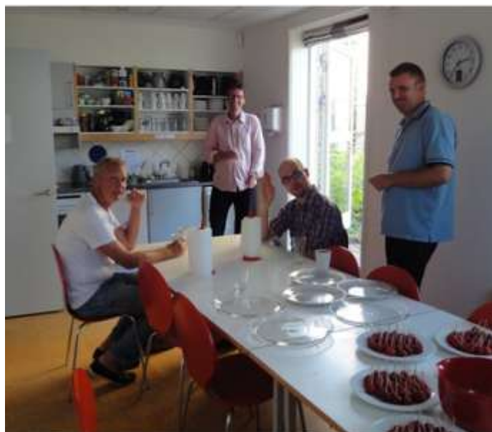
Der holdes en lille pause i forberedelserne..

Sommerarrangementet skulle først og fremmest være et socialt arrangement med spising og en lille koncert med husets kor. Samtidig var der også som noget nyt mulighed for at have pårørende med, hvilket mange benyttede sig af.