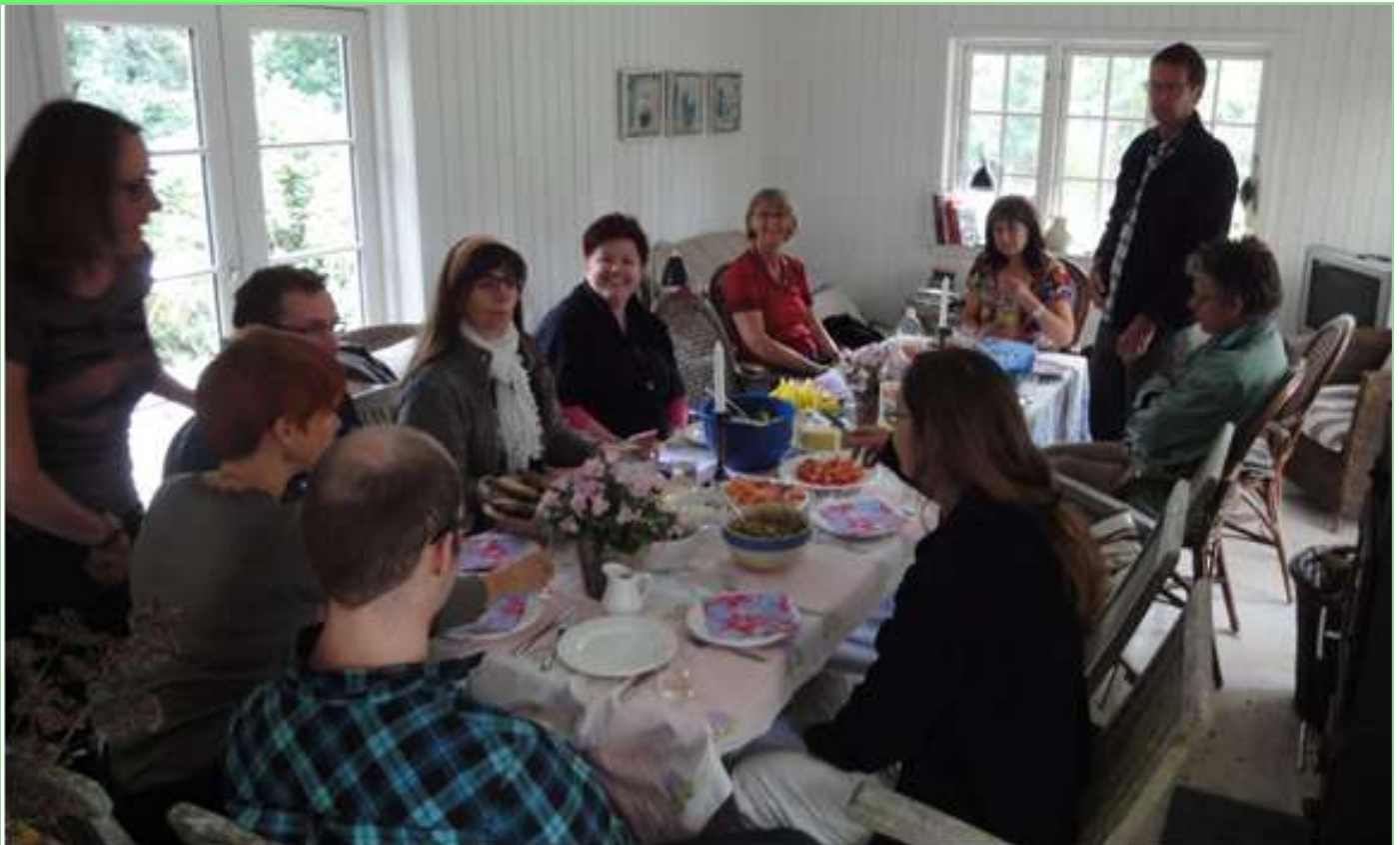
Så går vi til bords med speltkernesalat, vandmelonsalat, laks og brød.