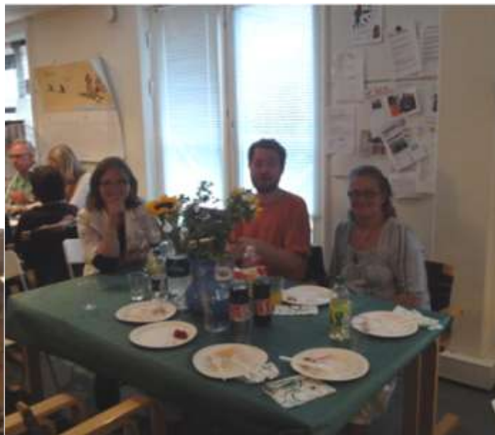
Tilhørerne gør sig klar til at høre koret synge.

Da alle var ved at være mætte, blev der budt på kaffe og chokolade, mens koret underholdt med 5-6 sange bl.a. med klassikere som "Tears in Heaven" og "With a little help from my friends".