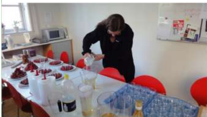
Velkomstdrinken gøres klar.