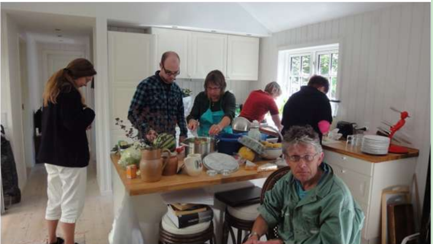
Her er der gang i produktion af salater.